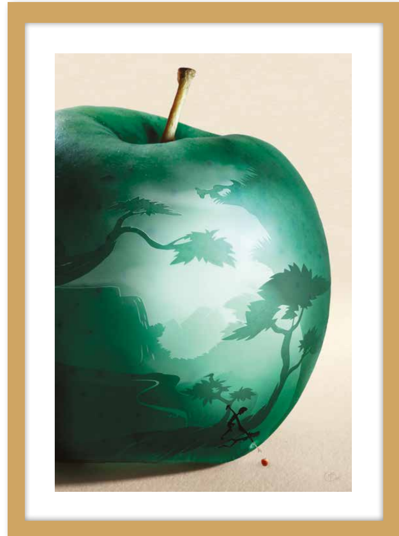
La tentation, par Myriam Schott

«Fil rouge Bible» est une collection de douze tableaux qui ont été réalisés par une dizaine d'artistes professionnels dans le domaine graphique et plastique. Chaque artiste représente une des grandes étapes de l'histoire Biblique avec un regard personnel qui toutefois reste le plus fidèle possible au sens des textes.