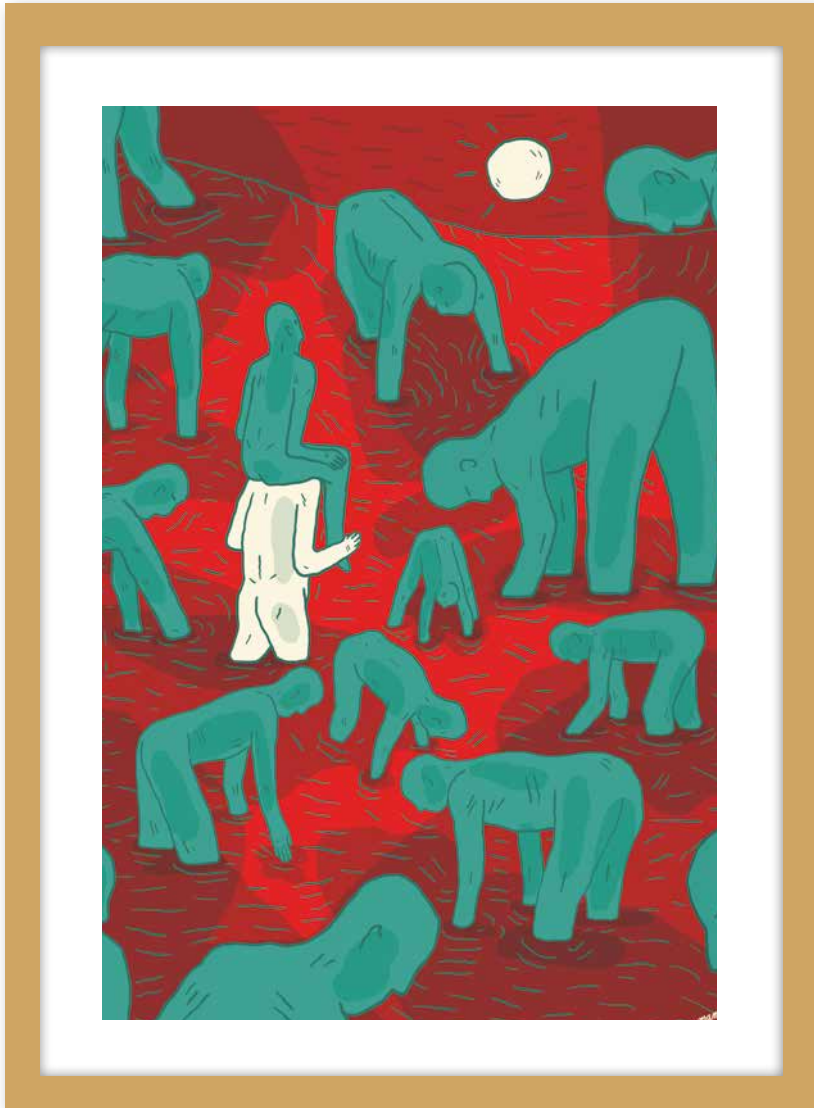
Sauvé du désespoir, par Emmanuel Bossanne